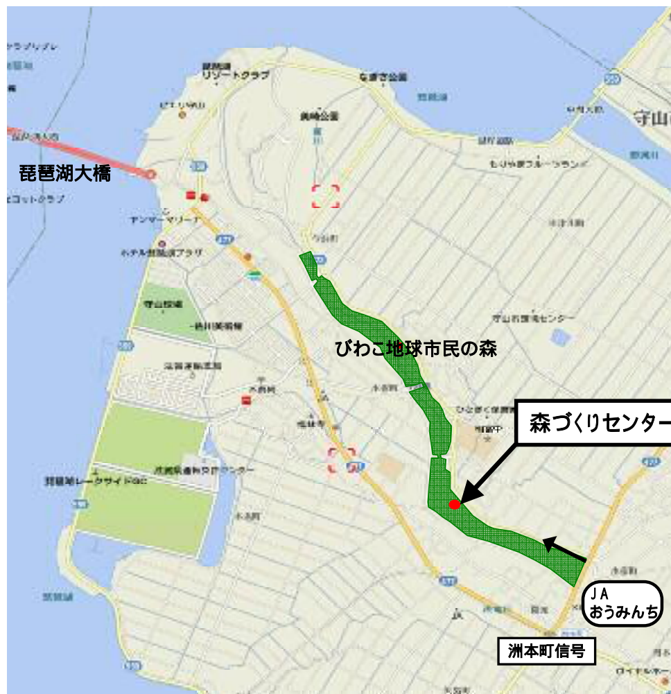
びわこ地球市民の森 森づくりセンター 位置図

耐震化率は72・3%。前年度は70・1%。二千校百八十八棟が未着手だが、本年度中に彦根東高と米町高で耐震化し、守山、水口両高で設計を開始する。