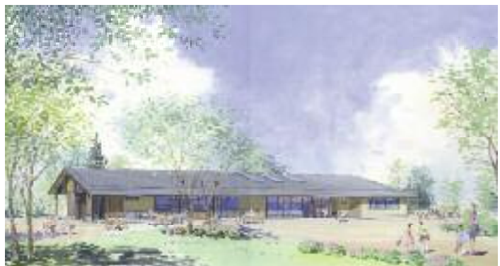
びわこ地球市民の森 森づくりセンター 外観パース