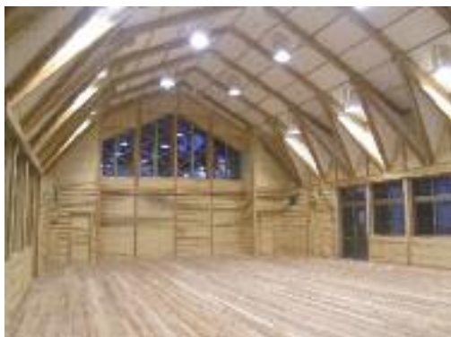
彦根東高校 特別教室棟 音楽室